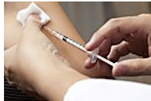
Virus de la grippe : 60 % de la population à risque n'est toujours...