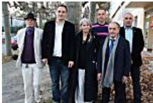
Présidentielle 2017. Les « petits » candidats...