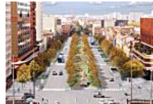
Toulouse aura ses ramblas fin 2019 et ça ressemblera à ça...