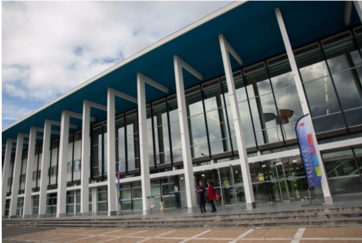
200 suppressions de postes sont prévues à l'université Paul-Sabatier.

La mobilisation se poursuit à l'université Toulouse 3 Paul-Sabatier. Les étudiants ont décidé de se joindre au mouvement lors d'une assemblée générale, organisée lundi 3 octobre, à laquelle étaient présentes 300 personnes. Ils contestent les 200 suppressions de postes prévues par le plan de développement, voté mercredi 28 septembre lors d'un conseil d'administration, qui doit permettre de combler le déficit de 15 millions d'euros de l'université. 1 500 heures de cours en présentiel devaient également être supprimées.